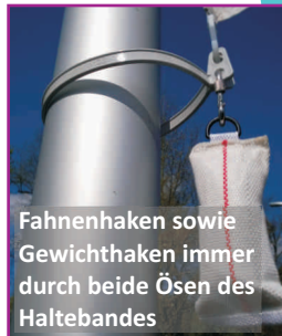
Fahnenhaken sowie Gewichthaken immer durch beide Ösen des Haltebandes