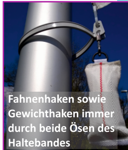
Fahnenhaken sowie Gewichthaken immer durch beide Ösen des Haltebandes